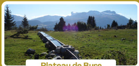
Plateau de Bure