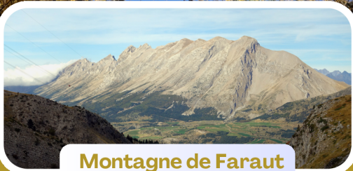
Montagne de Faraut