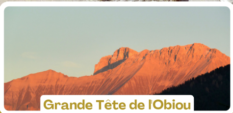
Grande Tête de l'Obiou